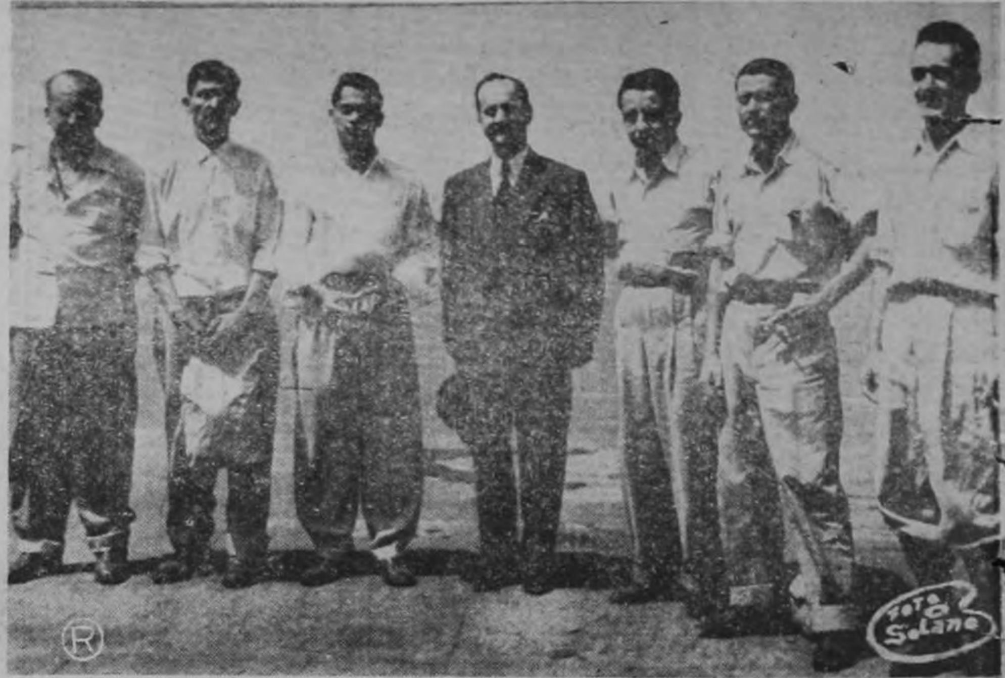
CON EL SR. PRESIDENTE.—Los seis costarricenses que estuvieron prisioneros de los invasores en Nicaragua posan especialmente para este periódico junto con el señor Presidente de la República don José Figueres Ferrer.