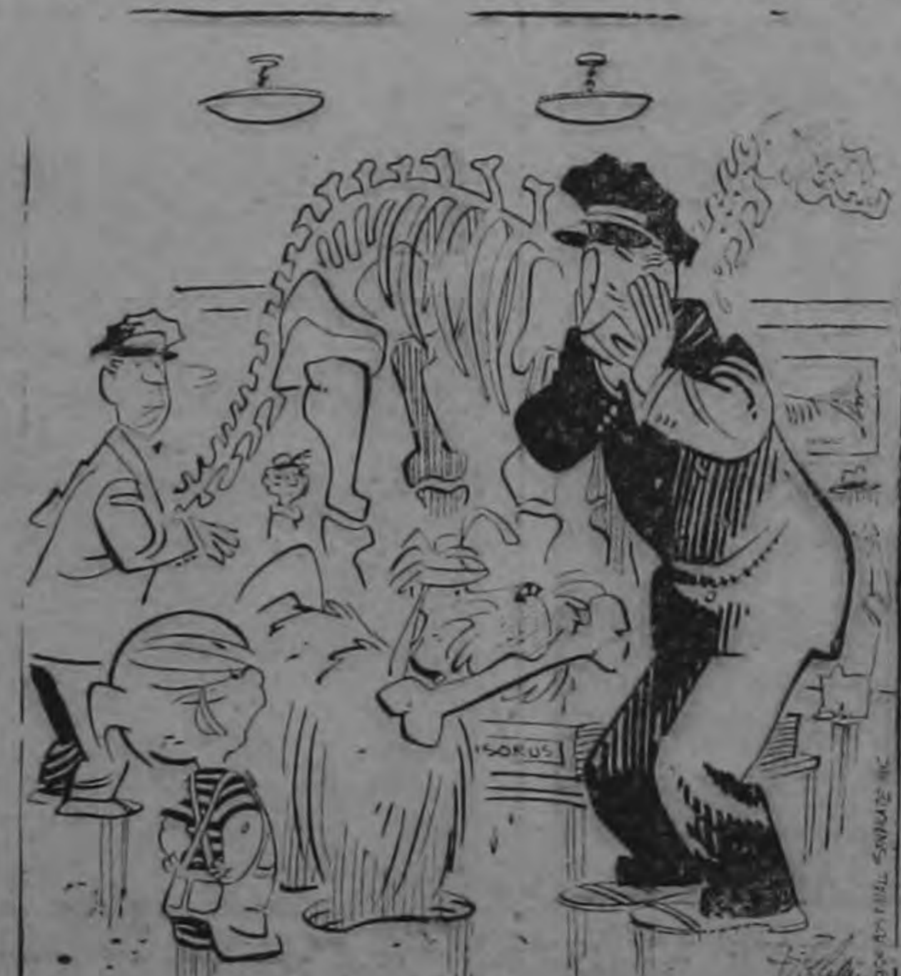
tanto pleito por un hueso

Así lo anunció a la Cancillería desde la semana pasada. Obtuvimos información del Departamento de Protocolo, que desde la semana pasada el Embajador del Brasil y su gentil esposa, anunciaron a la Cancillería su traslado al dominio del Canadá. Despedimos en forma atenta a tan distinguido diplomático por este ascenso, y deseamos que en el viaje que realizará en los próximos días, lleve el recuerdo grato de este país que lo aprecia.