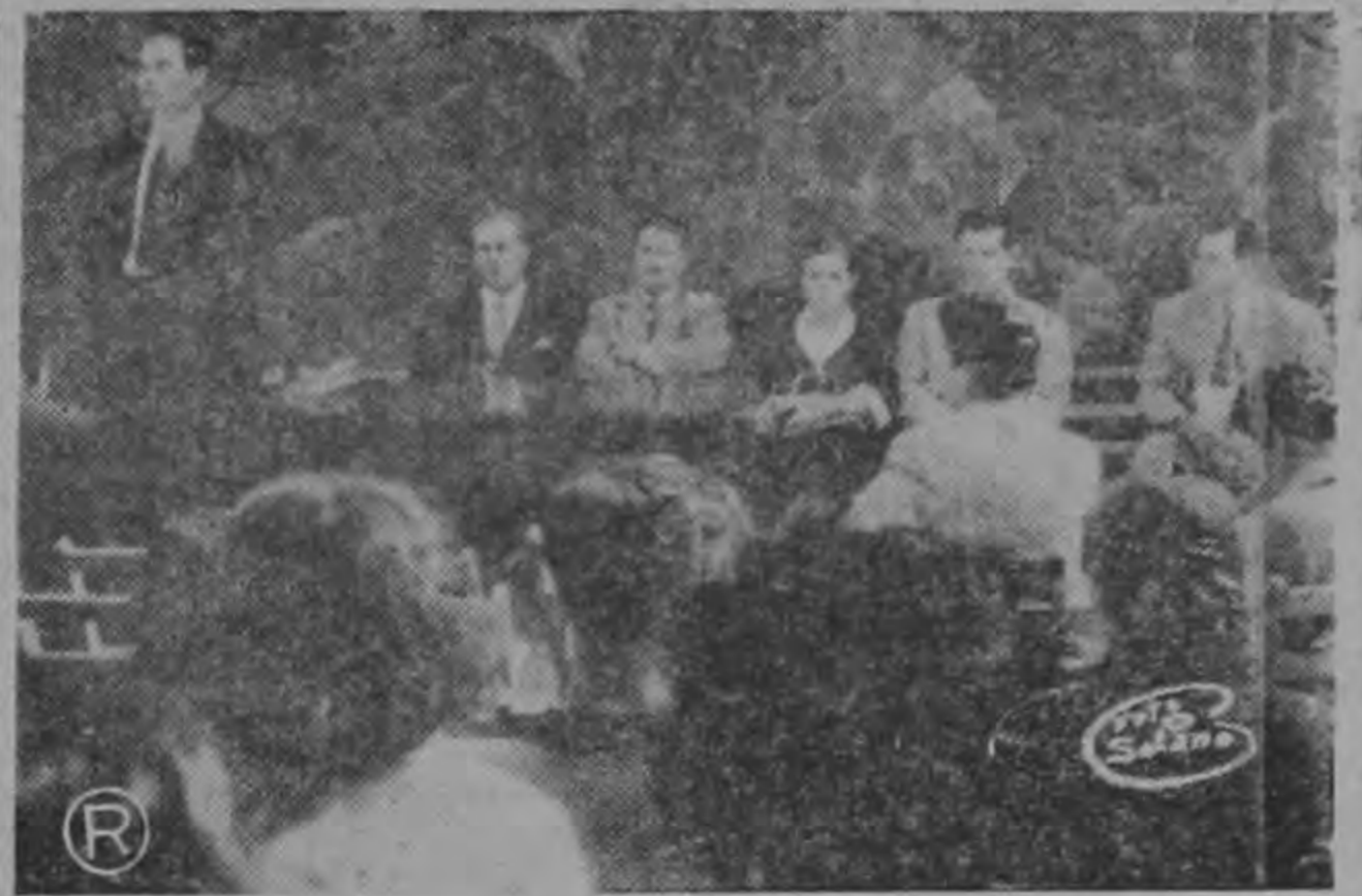
Altos personeros del Instituto Nacional de Vivienda y Urbanismo, al celebrarse el sábado 5 la inauguración de la cañería, en la Ciudadela Calderón Muñoz.